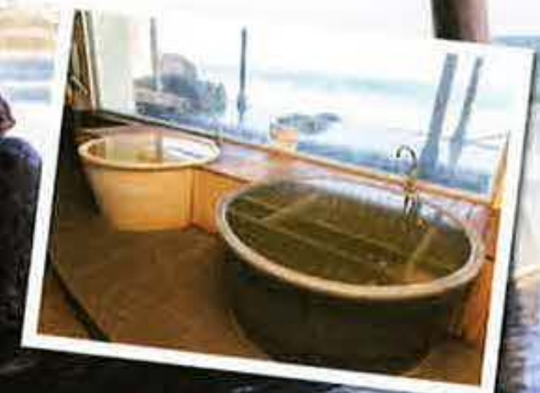
おひとりさまでつがる陶器風呂は、37.6°Cの低温源泉で、ゆっくり長風呂を楽しめる