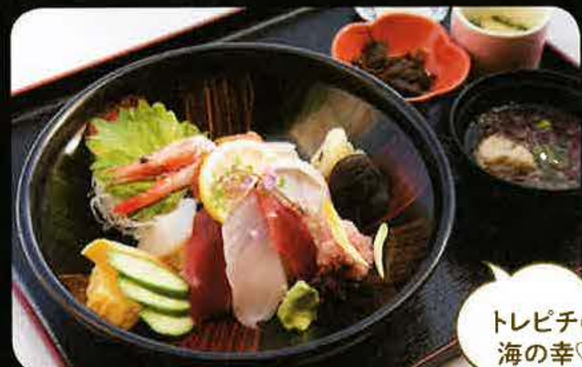
トレビチの海の幸♡

海の見えるダイニングで、銚子港で水揚げされた新鮮な地魚料理を味わえる。名産の金目煮魚定食や天ぷら定食、海鮮ちらし丼セットなど、6種の和食膳がお値打ち価格だ。小鉢、茶碗蒸し、つみれ入り味噌汁付きでボリュームも満点!