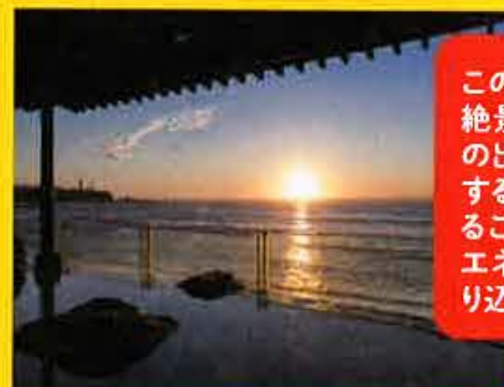
日の出を見ながら湯につかれるのは宿泊者だけの特権! 5:00〜9:00に朝風呂営業をしている

この宿は、お風呂から日の出の絶景を眺められるのが魅力。日の出を拝むとさらに効果が増大するので、時間があれば宿泊することをおすすめします。財のエネルギーを強く潜在意識にすり込むことができますよ