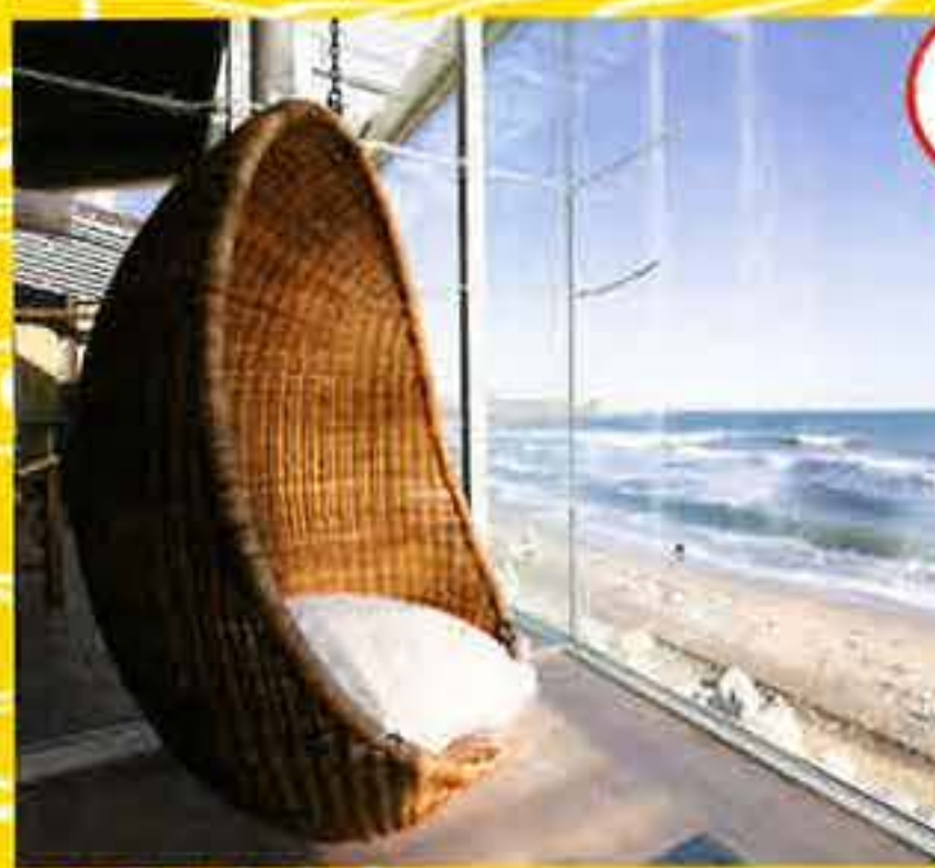
ロビーにはさまざまなタイプの椅子やソファが置かれ、海を眺めながら憩える