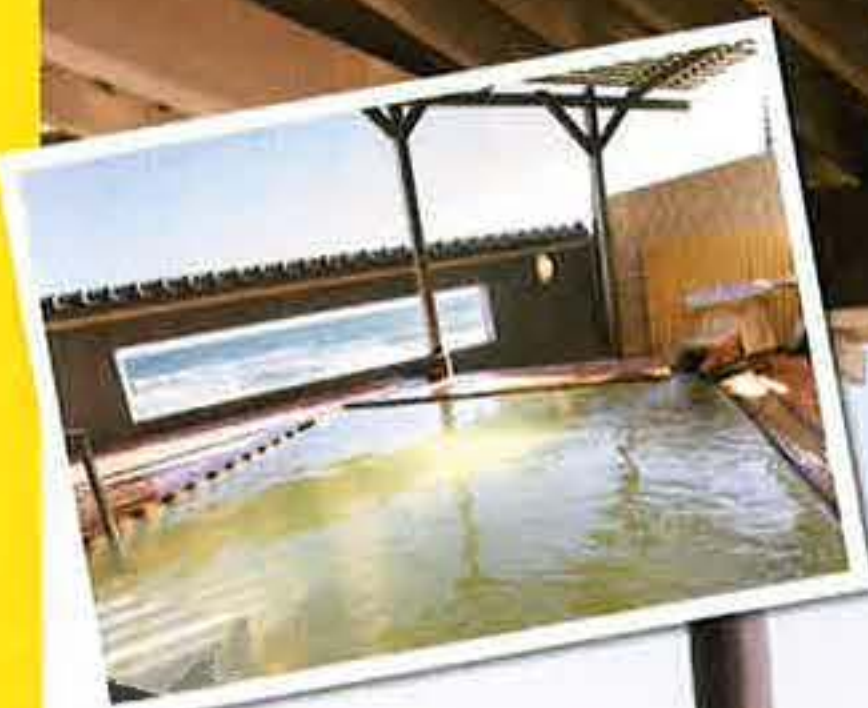
ヒノキ造りの湯舟がぬくもりあふれる露天風呂。光の具合で湯がウグイス色のように輝く